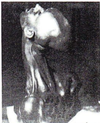
Scultura distacco dalla materia cm. 65 - Fusione in bronzo a cera persa

Museo Nazionale d'Abruzzo - Castello Cinquecentesco - Sala Elephas - 8/31 Luglio 1988